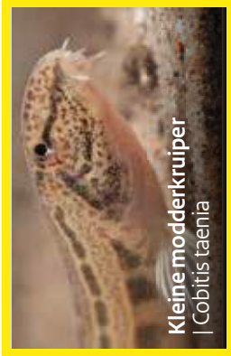
Kleine modderkruiper | Cobitis taenia