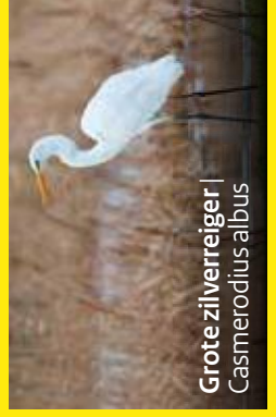
Grote zilverreiger | Casmerodius albus