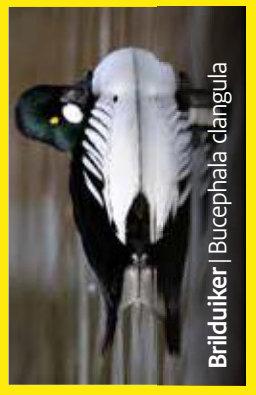
Brilduiker | Bucephala clangula