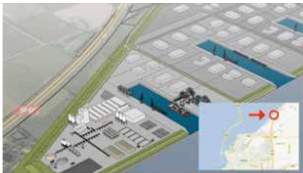
Plan van de container terminal bij Lelystad

Op initiatief van Sportvisserij Nederland, Hiswa, ANWB en het Watersportverbond (verenigd in de stichting Waterrecreatie IJsselmeer en Randmeren) werd op 28 maart j.l. in Bunschoten een conferentie gehouden over de waterplantenoverlast in de Randmeren en het Markermeer. Op deze conferentie waren naast diverse deskundigen ook de betrokken gemeenten en stichting Het Blauwe Hart aanwezig.