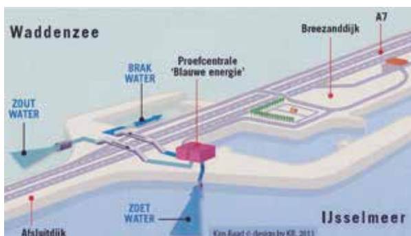
"Blue energy" centrale in de Afsluitdijk